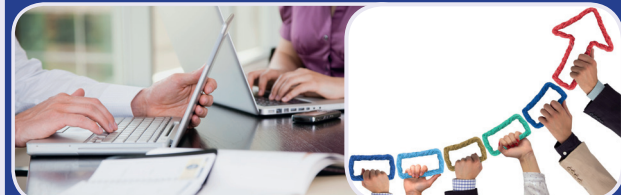
Akademsko zvanje se nominiraju aktom "Nomenklatura stručnih, akademskih i naučnih zvanja", a u skladu sa zakonskim propisima koji regulišu ovu oblast. Nastavni plan i program usvaja Senat Univerziteta.

SREDNJOŠKOLSKI CENTAR "ТЕМІТ АПЕІРОН" Banja Luka www.apieiron-gemlit.org